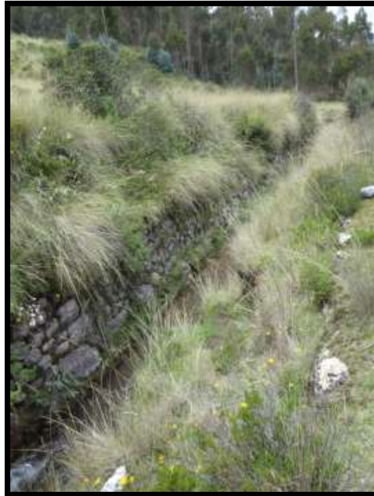
Imagen 20 - Canalización del riachuelo de Tambomachay, en toda la extensión de la quebrada.