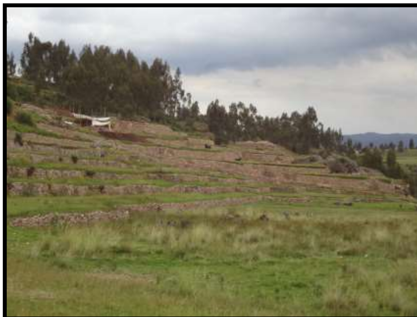
Imagen 6 Vista del sub sector – C – del complejo arqueológico de Inkilltambo