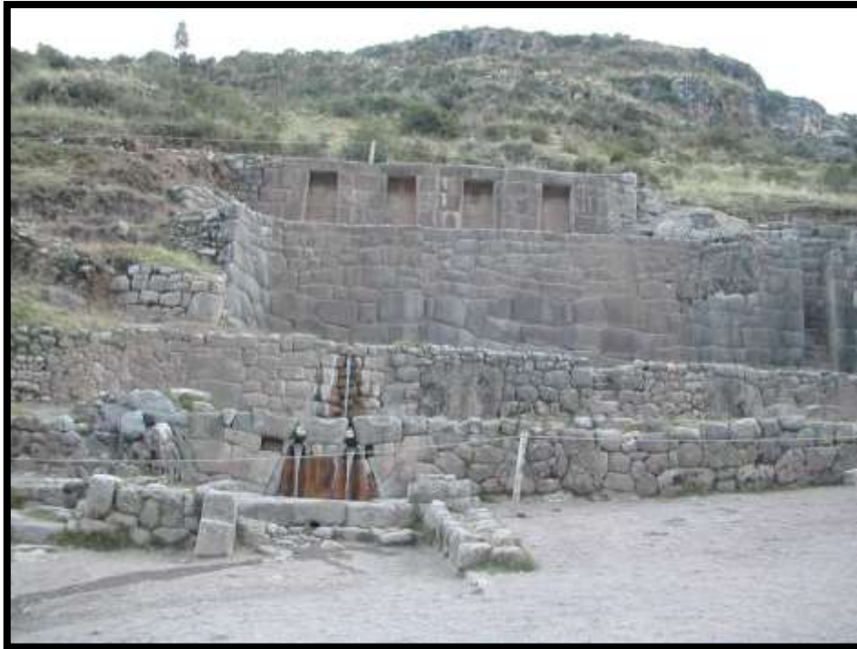
Imagen 2 - Complejo arqueológico de Tambomachay