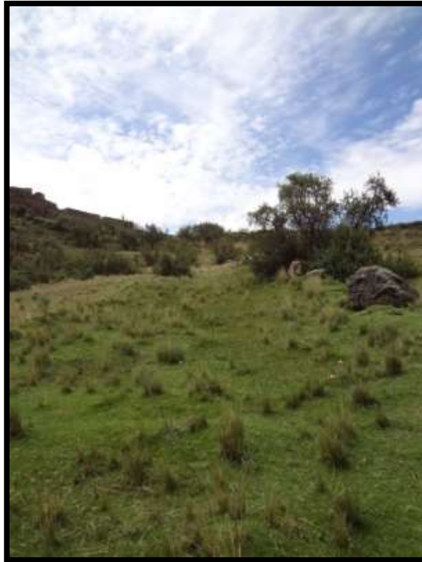
Imagen 18 - Qhapaq Ñan propuesto para recuperar como vía de descenso hacia la quebrada de Tambomachay.