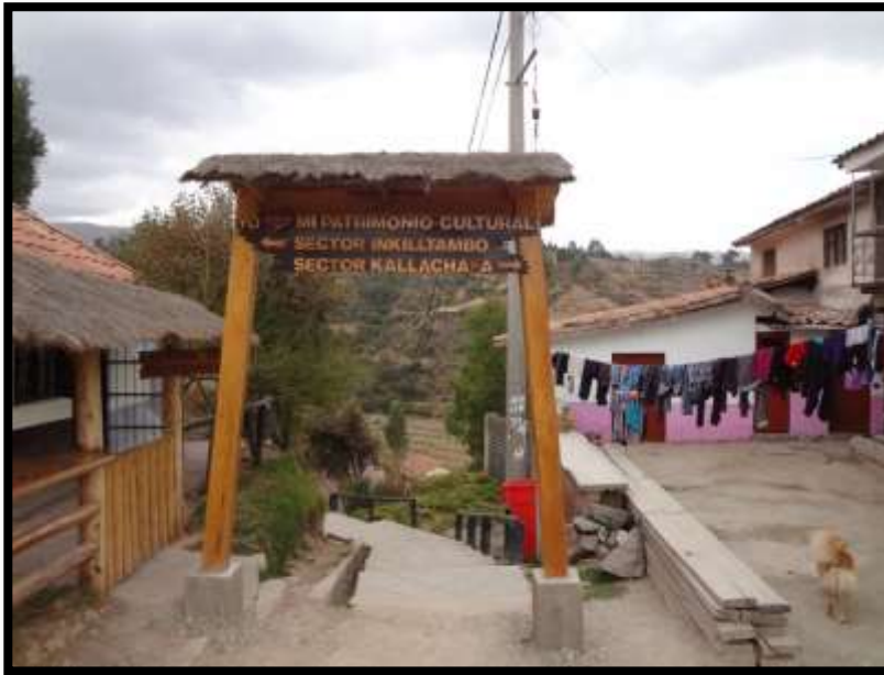
Imagen 32 - Final del circuito turístico de la quebrada de Tambomachay.