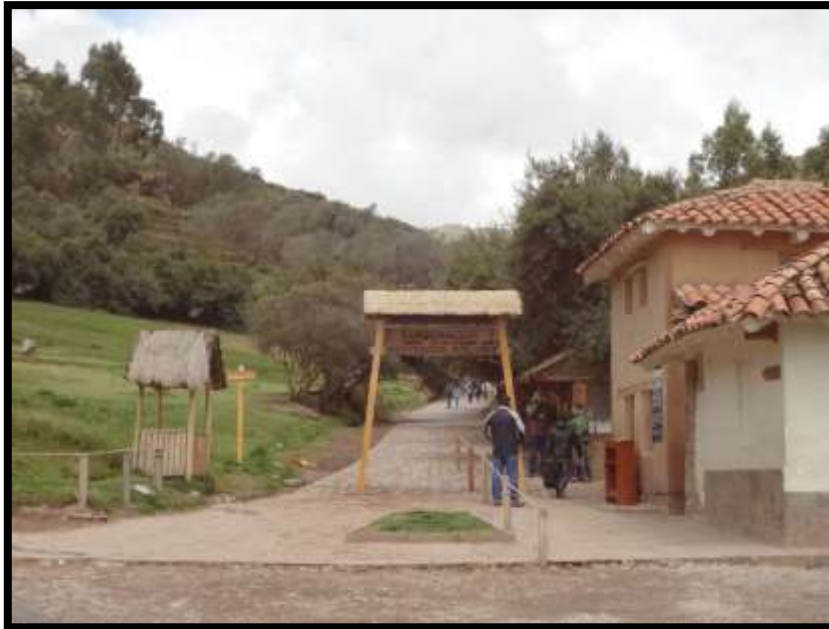
Imagen 16 - Inicio del circuito turístico, entrada hacia Tambomachay.