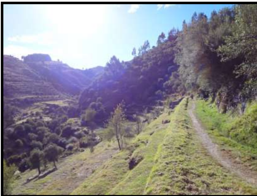
Imagen 31 - La quebrada de Tambomachay visto desde el sector agrícola de Choqekiraw Pukyo.