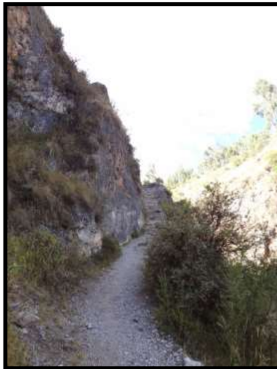
Imagen 25 - Escaleras pre - hispánicas saliendo de Inkilltambo con dirección hacia Choqekiraw Pukyo.