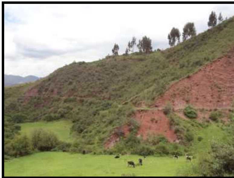
Imagen 27 - Sendero hacia Choqekiraw Pukyo.