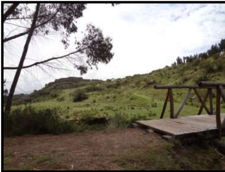
Imagen 17 - Camino de herradura hacia Tambomachay, provisto de un puente de madera que ayuda a cruzar el riachuelo.