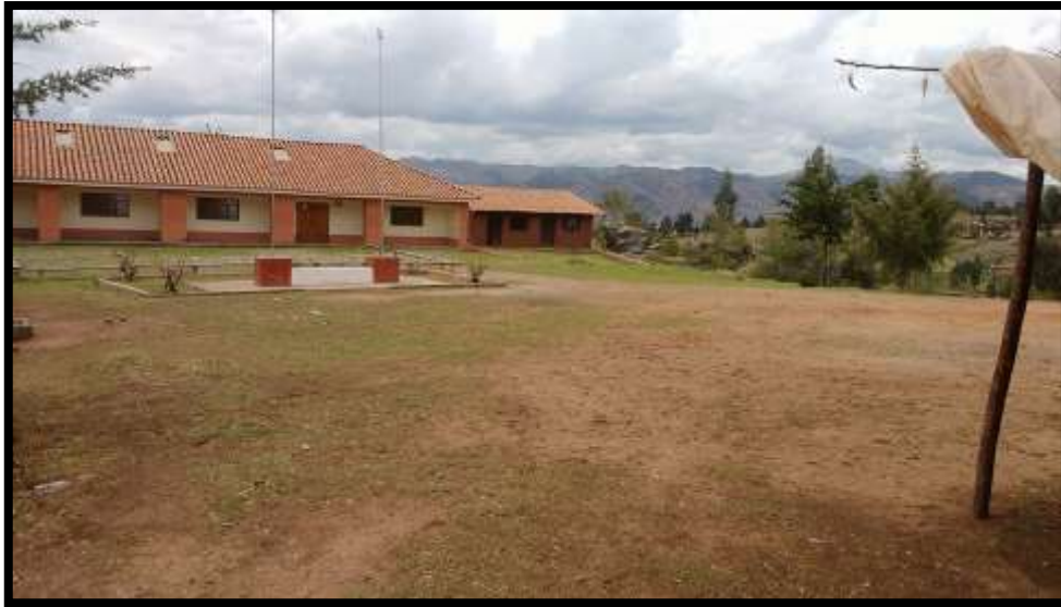
Imagen 24 - Salón comunal de la Asociación de Productores "Los Huertos", donde se establecerá un Mercadillo Artesanal.