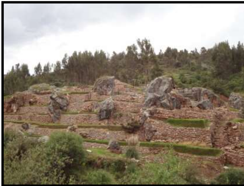
Imagen 23 - Sub sector - B - ya restaurado.