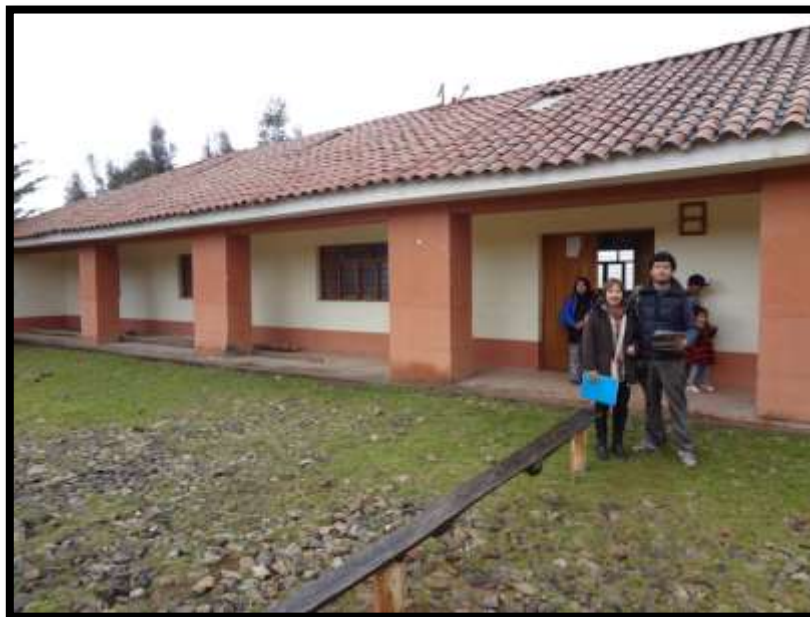
Imagen 15 - Señora Rayda Jesús Delgado motivadora del desarrollo turístico en los "Los Huertos".