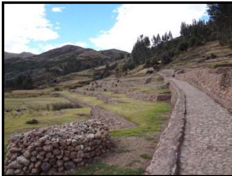
Imagen 21 - Acceso principal hacia Inkilltambo.