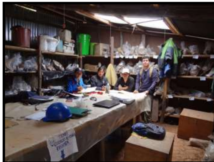
Imagen 11 - Base arqueológica de Inkilltambo con el equipo de profesionales.