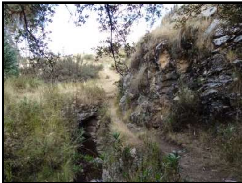
Imagen 19 - Sendero a nivel del riachuelo de Tambomachay, que nos conducirá hacia la quebrada.