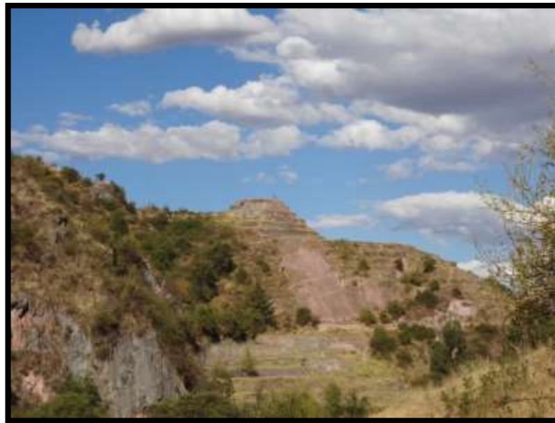
Imagen 5 - Complejo arqueológico de Choqekiraw Pukyo