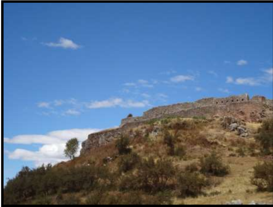
Imagen 3 - Complejo arqueológico de Puca Pucara