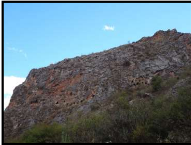
Imagen 26 - Contextos funerarios a la salida de Inkiltambo.