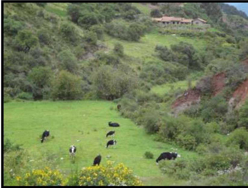
Imagen 28 - Claros de la quebrada utilizados por familias para el pastoreo de vacunos, en la esquina superior la ex hacienda Eureka propiedad actual de la familia La Torre que cuentan con un pequeña pici granja para la crianza de truchas.