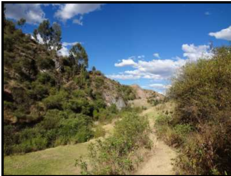
Imagen 29 - Choqekiraw Pukyo visto desde unos de los senderos que conducen hacia allí.