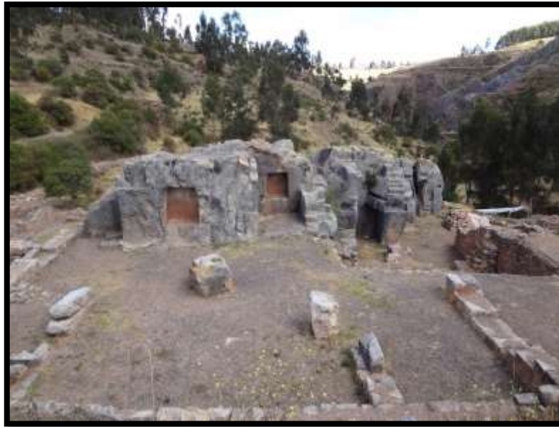
Imagen 22 - Sector Sacro de Inkiltambo.