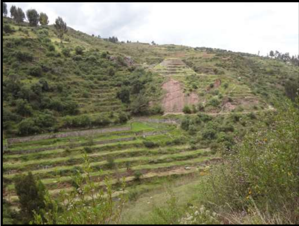
Imagen 7 - Vista panorámica de los andenes circulares de Machu Choqekiraw Pukyo