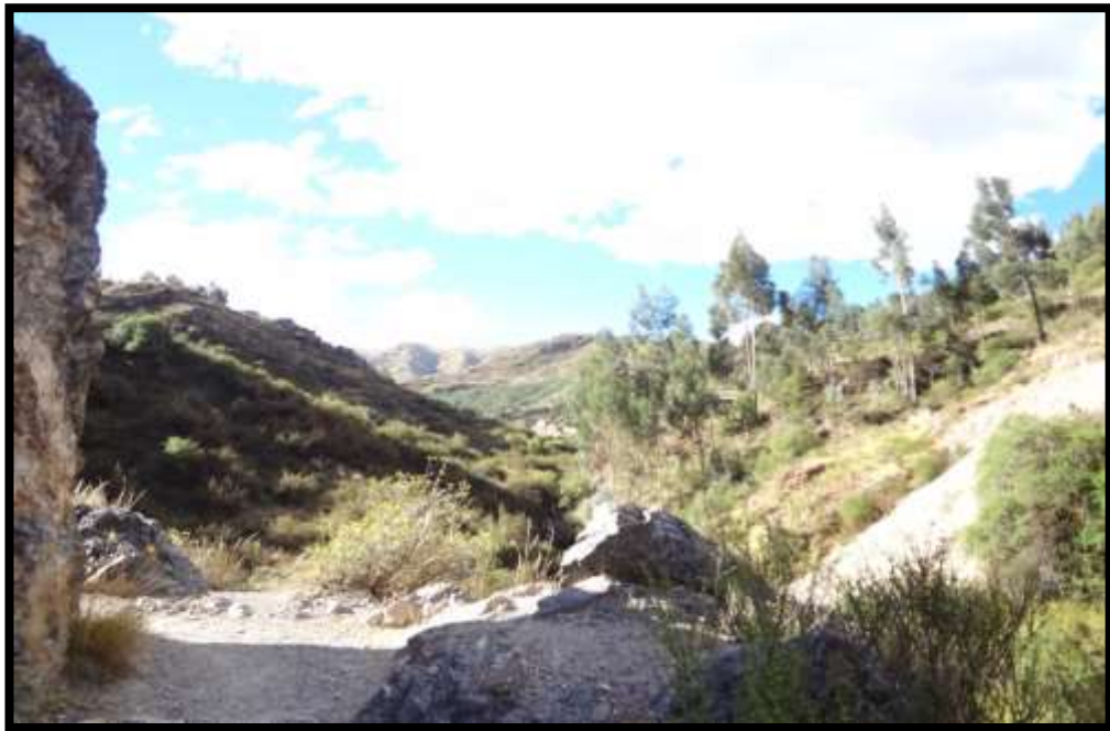
Imagen 1 - Vista de la quebrada de Tambomachay

de suaves pendientes que atraviesan y modelan la Meseta de Saqsaywaman, hasta desembocar en el valle formado por el río Watanay, en el distrito de San Sebastián.” (Zecenarro; 2001)