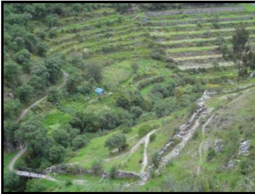
Imagen 30 - Vía de acceso hacia Choqekiraw Pukyo.