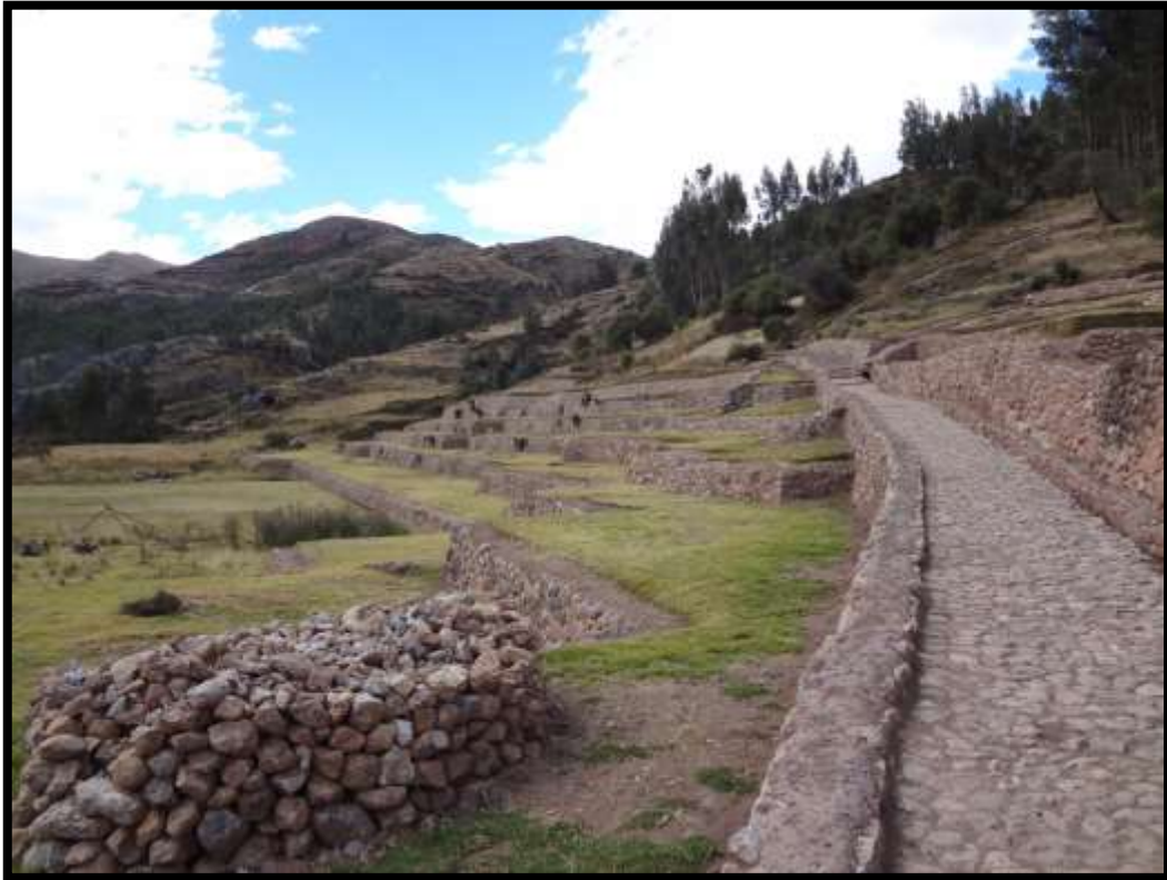
Imagen 4 - Complejo arqueológico de Inkilltambo (Inca Cárcel) – Sub sector “A”