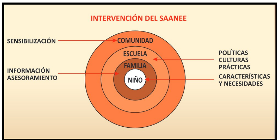
Figura Nª 03: Intervención del SAANEE

El Servicio de Apoyo y Asesoramiento para la atención de estudiantes con Necesidades Educativas Especiales-SAANEE, funciona como una unidad operativa itinerante que tiene la responsabilidad de orientar y asesorar al personal directivo y docente de las instituciones educativas inclusivas de todos los niveles y modalidades del sistema educativo, para una mejor atención a los estudiantes con discapacidad, talento y superdotación.