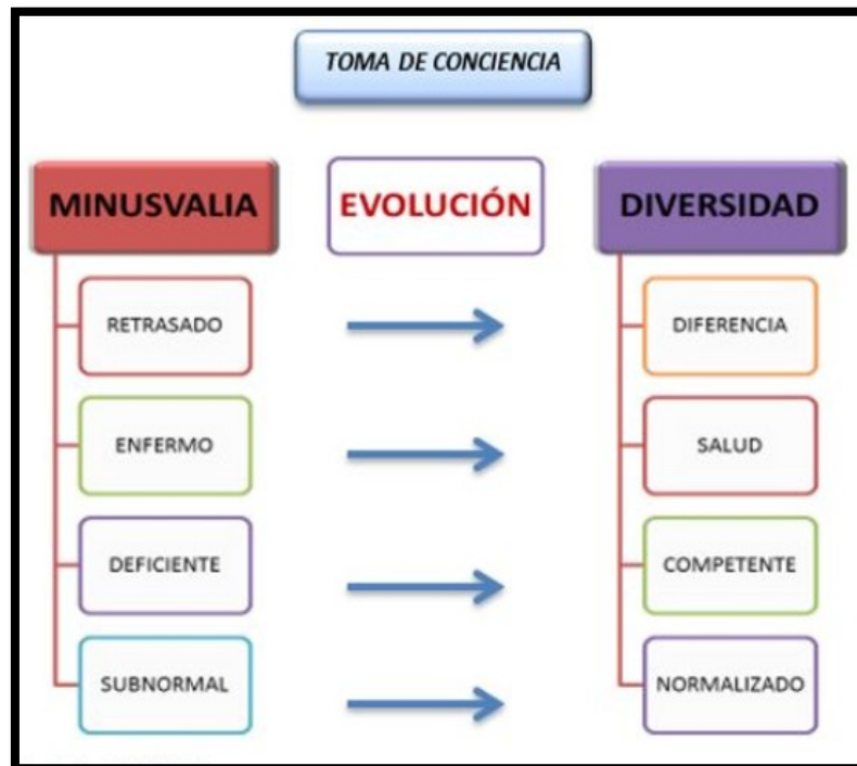
Figura N° 02: Diferencia entre minusvalía y diversidad

más que todo para lograr un cambio en las conductas sociales de las personas frente al grupo de personas con habilidades diferentes.