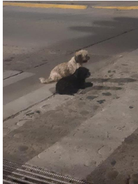
Perritos en estado de abandono merodeando por la Av. General Gamarra a la altura del Hospital de Quillabamba.