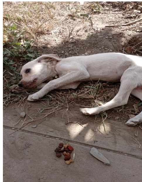
Perritos en estado de abandono viviendo a inmediaciones de la Alameda Bolognesi en la ciudad de Quillabamba.