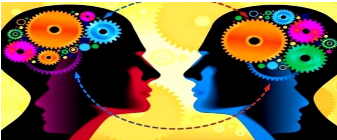
Figura 3. (Conducta biológica).

Asimismo lo contemplado en el apartado 17 de la Convención Americana de Derechos Humanos (CADH) argumenta: “la sociedad y el Estado” está basado en que la institución de la familia, que se encuentra facultada siempre cuando acaten los acuerdos señalados, conforme a la legislación interna de cada Estado.