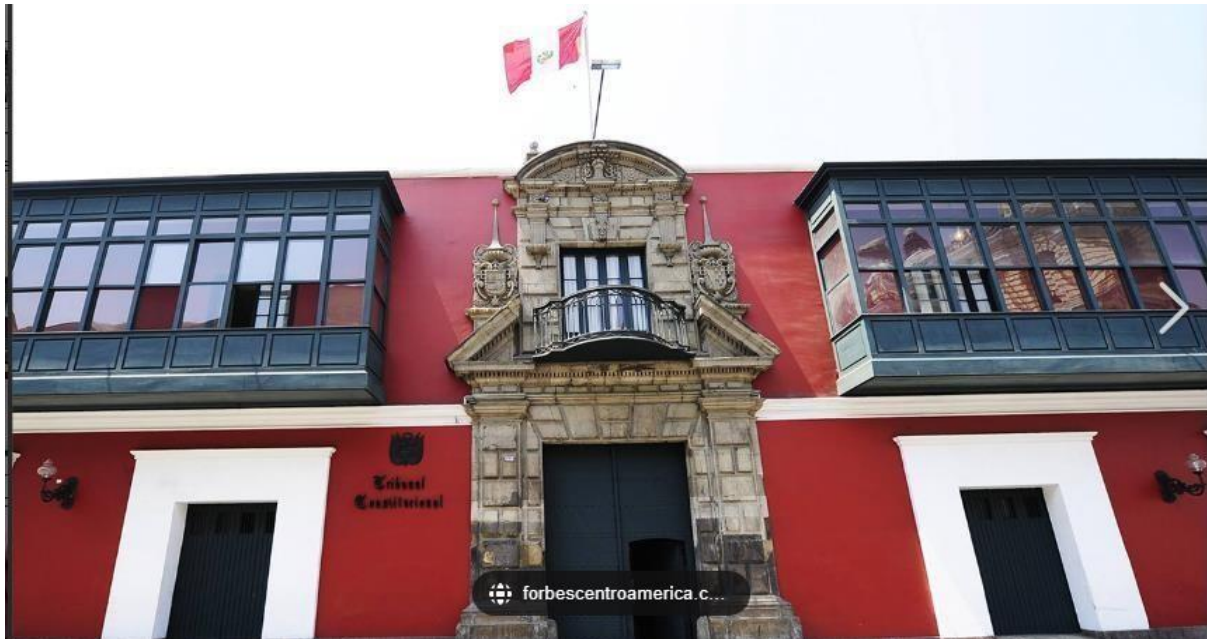
Figura 4. (Tribunal Constitucional)

a los 15 años, aún cuando el Tribunal Constitucional ha señalado con anterioridad específicamente en el expediente N° 02132-2008-PA/TC-ICA, del nueve de marzo del año dos mil once, han indicado que las pensiones o deudas de los alimentos del menor no prescribe, siempre se tiene que pagar por parte del obligado.