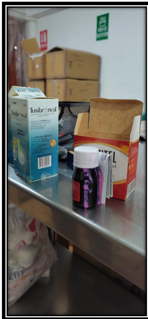
Medicamento de vía oral dañado con el contenido expuesto fuera de su envase.