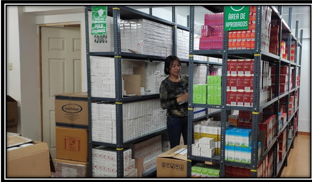
Uno de los Almacenes de la Droguería Inka S.A.C.