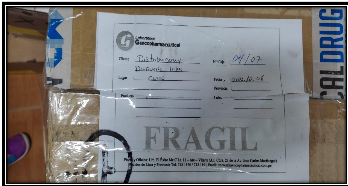
Caja abierta con medicamentos dañados