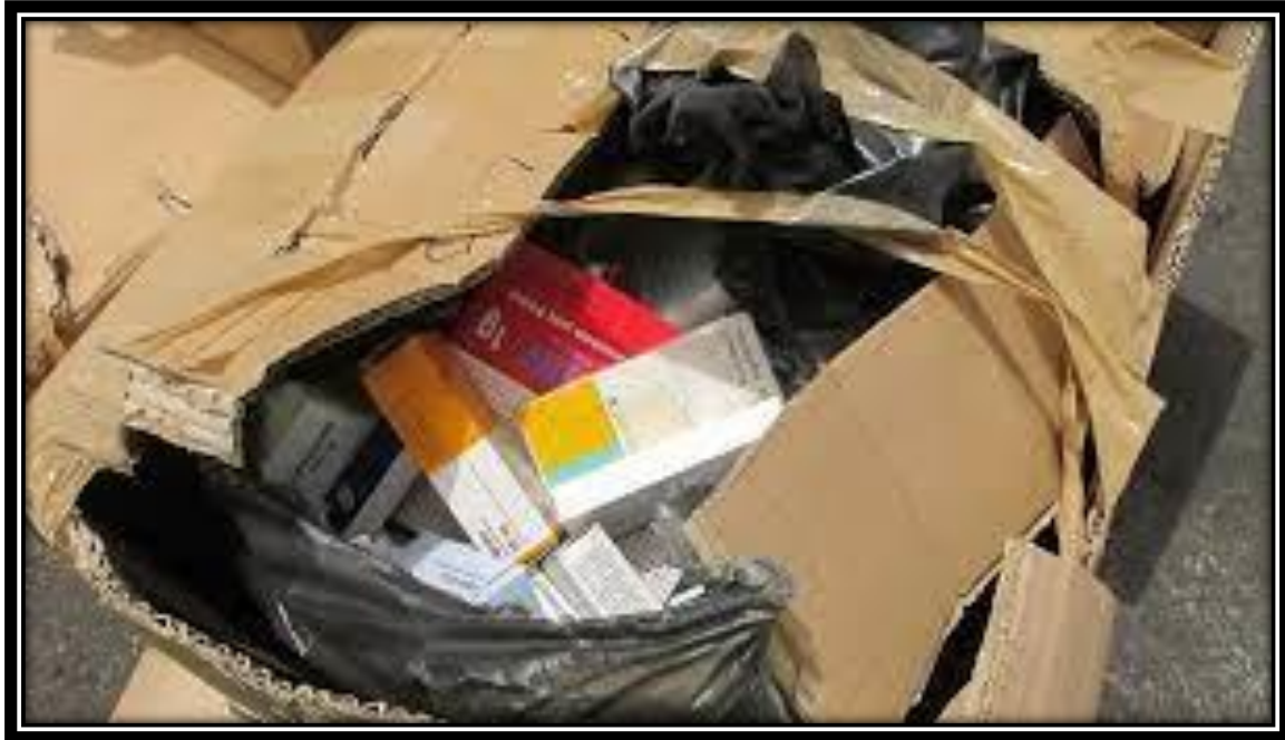
Otros medicamentos que pasaron su fecha de vencimiento