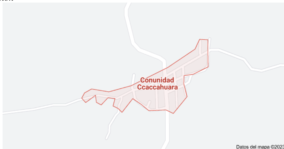
Figura 2 Ubicación

Comunidad de Ccacahuara es una de las 13 comunidades del Distrito de Ancahuasi, ubicada en la Provincia de Anta departamento de Cusco.