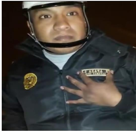
Figura 3 Control de identidad