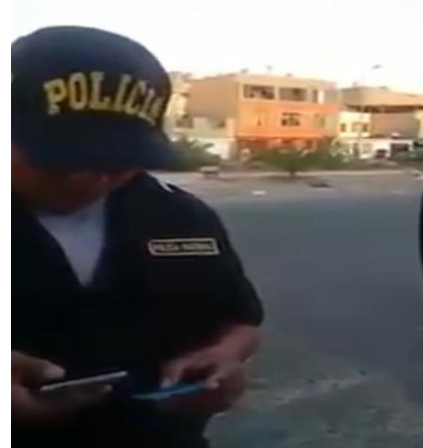
Figura 5 Intervención de control de identidad