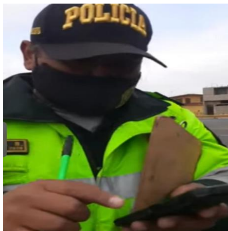
Figura 6 Efectivo policial solicita abrir la maletera