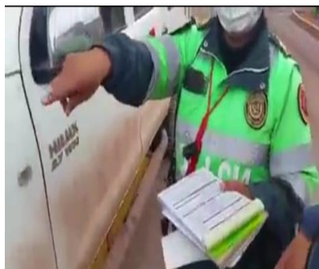
Figura 2 Intervención vehicular