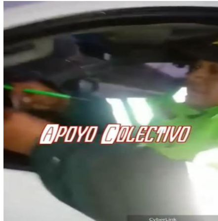
Figura 7 Fiscalización de cumplimiento de normas de tránsito