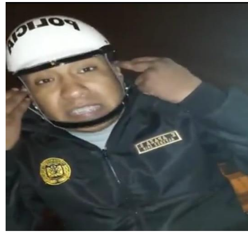
Figura 3 Desconocimiento de la normativa