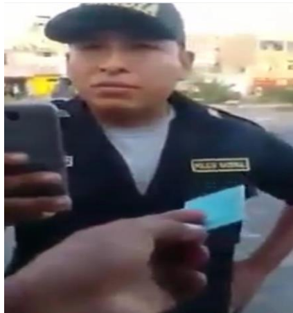
Figura 5 Intervención por pasarse la luz roja