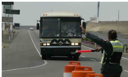
Figura 1 Intervención en carretera

Las dos casuísticas solo son referencias muestrales, toda vez que existen casos muchos más frecuentes, lo que sin duda genera la desconfianza y desconcierto de la ciudadanía, respecto a cuáles son los límites de la Policía Nacional en dichos casos y cuáles son los derechos de los ciudadanos que se pueden reclamar durante tal intervención policial, ya que toda intervención debe realizarse respetando los derechos de las personas.