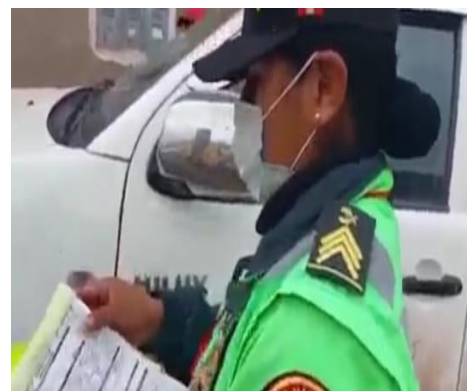
Figura 2 Imposición de papeleta de tránsito