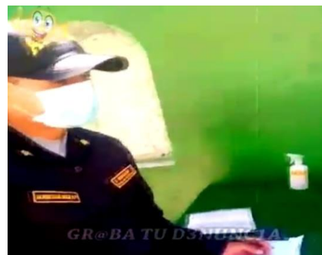
Figura 4 Aplicación de papeleta con infracción M-41