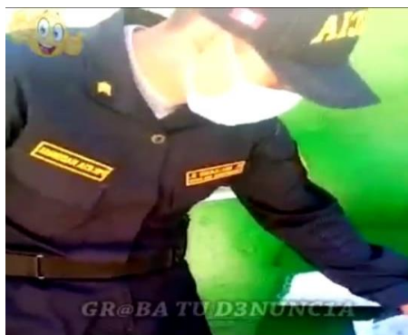
Figura 4 Intervención por llevar 02 pasajeros