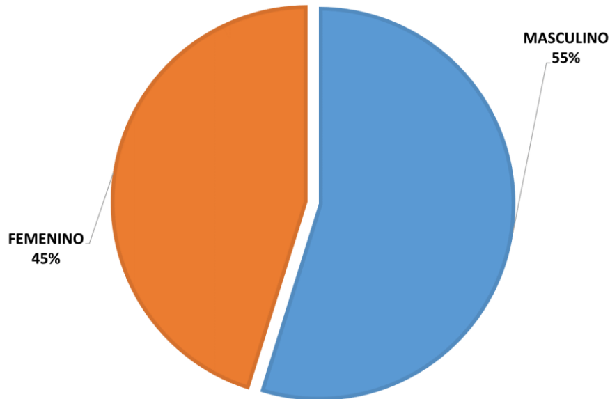
Figura 2 Proporción de residentes