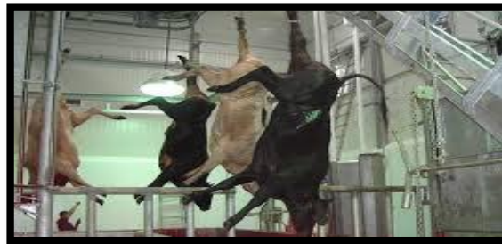
Figura 6. Proceso de izado