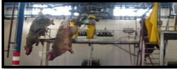
Figura 8. Proceso de corte de patas y cabeza