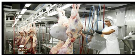
Figura 11. Proceso de fisurado