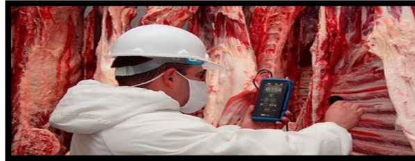
Figura 12. Proceso de inspección veterinaria post mortem

Proceso de higiene y desinfección: Es la aplicación de agua a presión y/o ácido orgánico sobre las superficies corporales, para desinfectar al animal de posibles contaminaciones propias del manipuleo y el eviscerado. (Empresa Pública Metropolitana de Rastro, 2018)