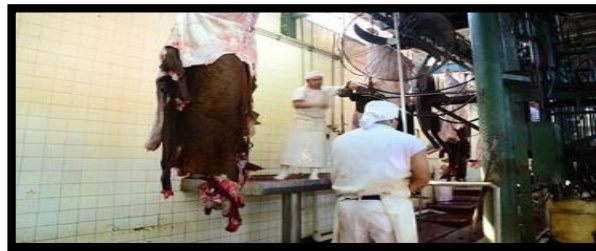
Figura 9. Proceso de desollado