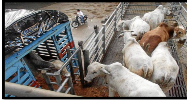
Figura 2. Proceso de recepción