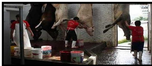
Figura 7. Proceso de sangrado y degüello