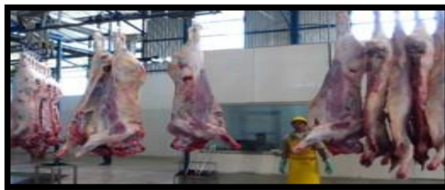
Figura 13. Proceso de higiene y desinfección

Proceso de higiene y desinfección: Es la aplicación de agua a presión y/o ácido orgánico sobre las superficies corporales, para desinfectar al animal de posibles contaminaciones propias del manipuleo y el eviscerado. (Empresa Pública Metropolitana de Rastro, 2018)