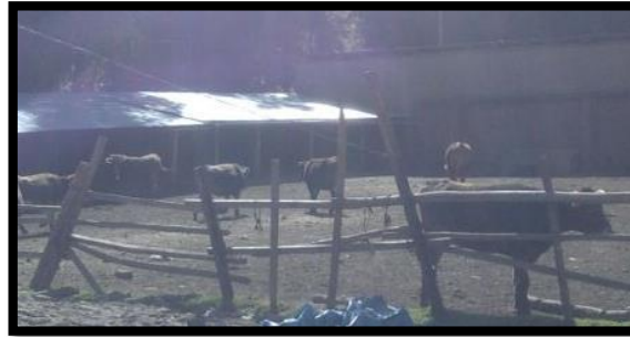
Figura 3. Proceso de corralaje de animales de abasto