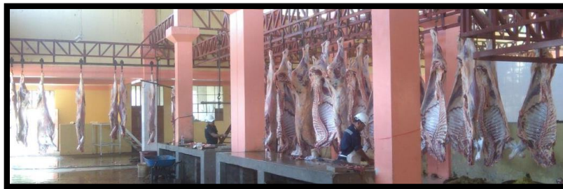
Figura 14. Camal Municipal Trapiche Nota: fotografía del camal municipal Trapiche

agricultura y ganadería una fuente de ingreso sus actividades económicas más importantes de la comunidad. El Camal Municipal de Trapiche es un establecimiento con un perímetro de 10.099.29 M2 donde se realiza el servicio de matanza y faenado de todo tipo de ganado, transporte de carne en condiciones higiénicas para el consumo humano. Es administrado por la Municipalidad Provincial de Canchis, presta servicios de faenado a los distritos de Tinta, Combapata y comunidades aledañas, la cantidad de faenado de animales de abasto es un aproximado de 400 a 500 cabezas de ganado por mes, donde cuenta con una instalación acondicionado para realizar el faenado adecuado.