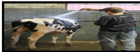
Figura 4. Proceso de arreo y duchado