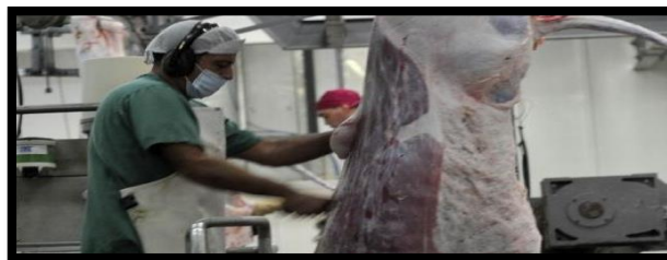
Figura 10. Proceso de eviscerado