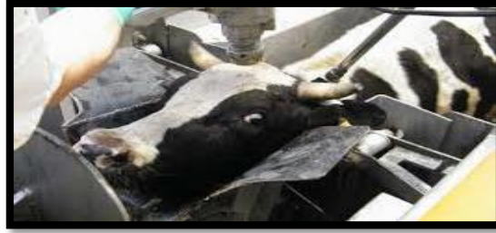
Figura 5. Proceso de noqueo