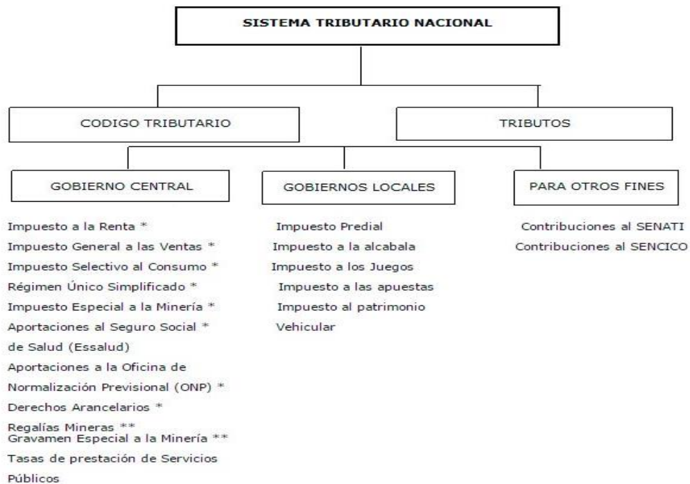
Figura 6. Esquema del Sistema Tributario Nacional.

Según Superintendencia Nacional de Aduanas y de Administración Tributaria.