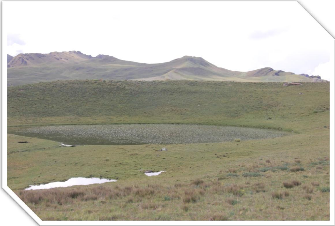
Imagen Nro. 7.9: Lagunilla en la Comunidad de Huaccoto