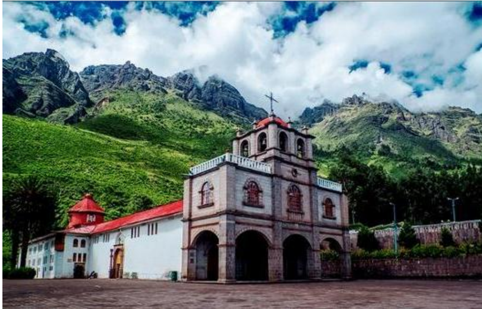
Imagen 05-Santuario del Señor de Huanca.