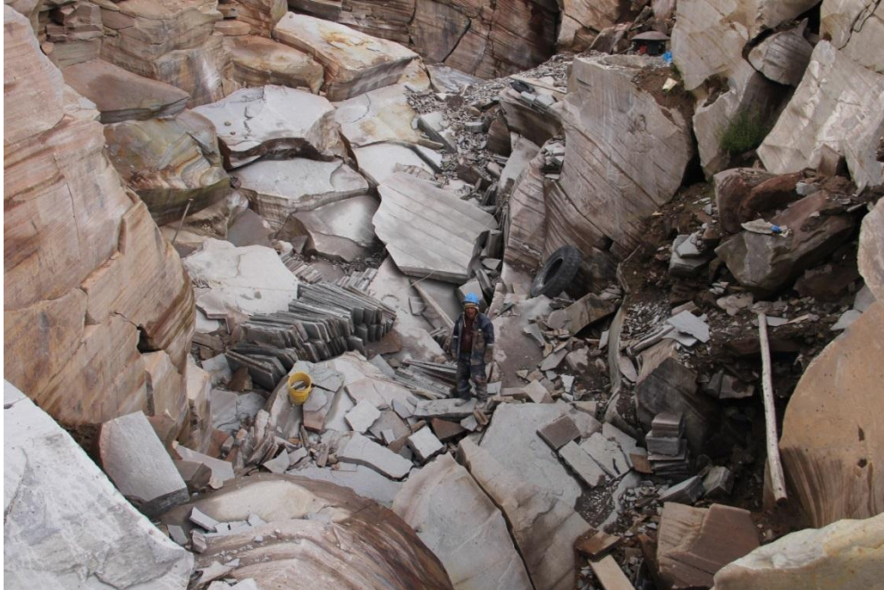
Imagen 04-Cantera de Huaccoto.