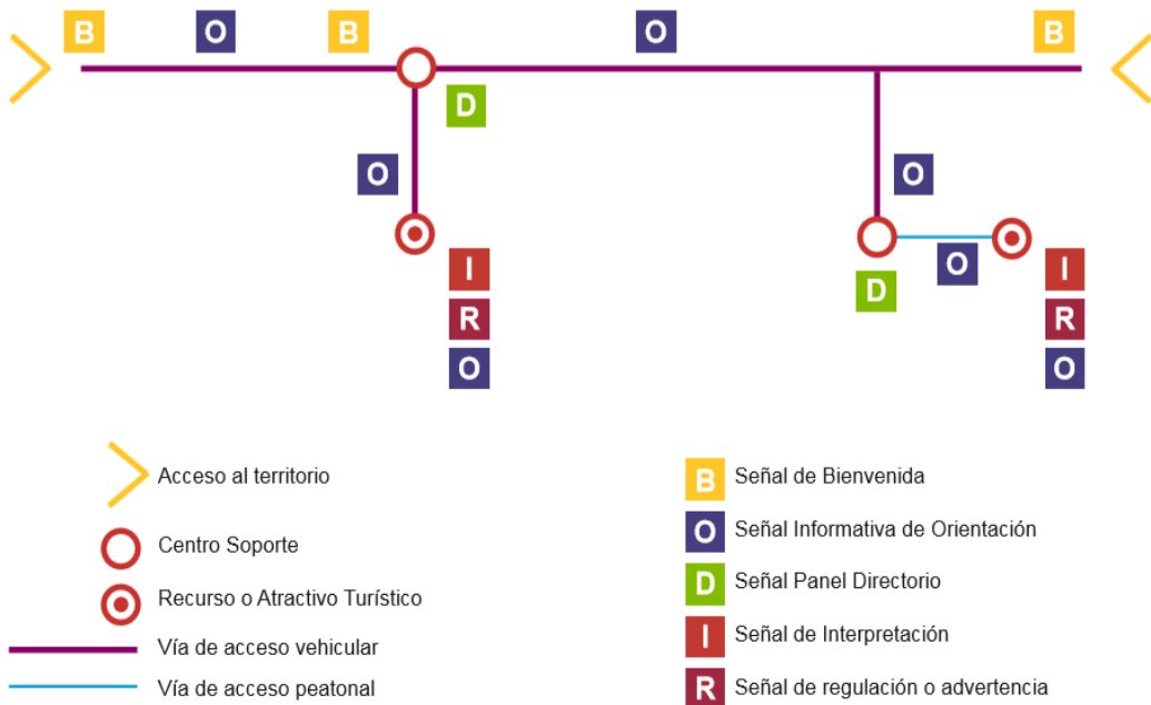
Grafico x: diagrama del sistema de señalización turística (MINCETUR, MANUAL DE SEÑALIZACION TURISTICA DEL PERU, 2016).