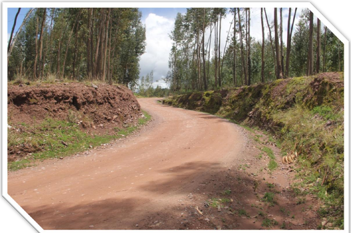
Imagen Nro. 7.4: Carretera San Jeronimo - Comunidad Campesina de Huaccoto.