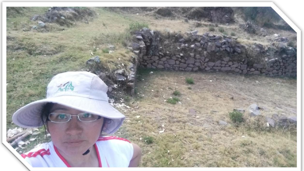
Imagen Nro. 7.2: Sitio Arqueológico de Raqaraqayniyoc.