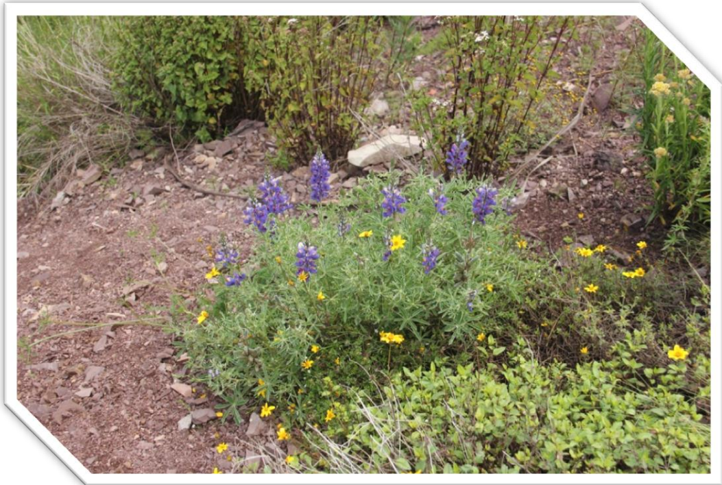
Imagen Nro. 7.5: Flora natural de las zonal alto andinas