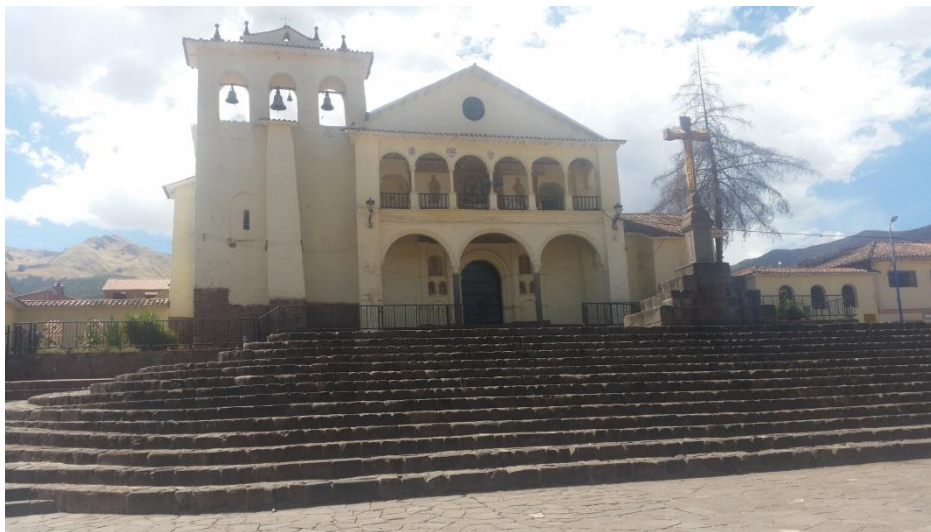
Iglesia de San Jerónimo.