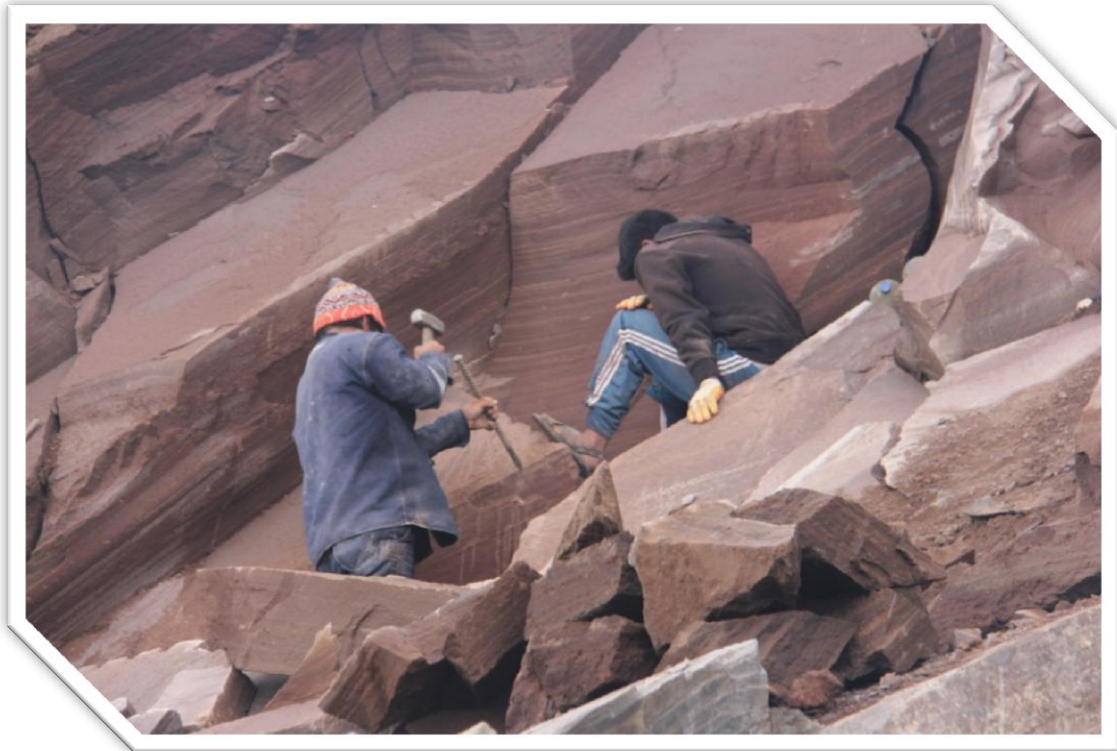
Imagen Nro. 7.7: Picapedreros de la Comunidad de Huaccoto.