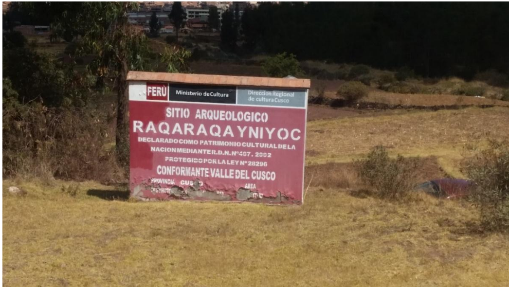
Imagen 02-Sitio Arqueológico de Raqaraqayniyoc.