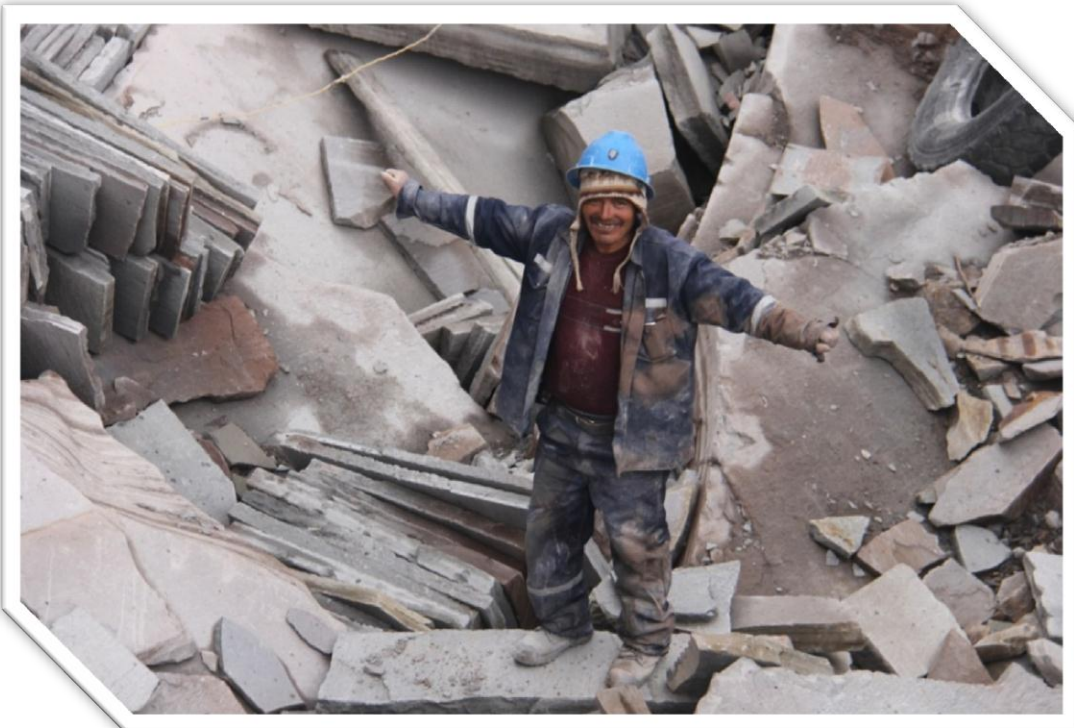
Imagen Nro. 7.10: Picapedrero de las canteras.