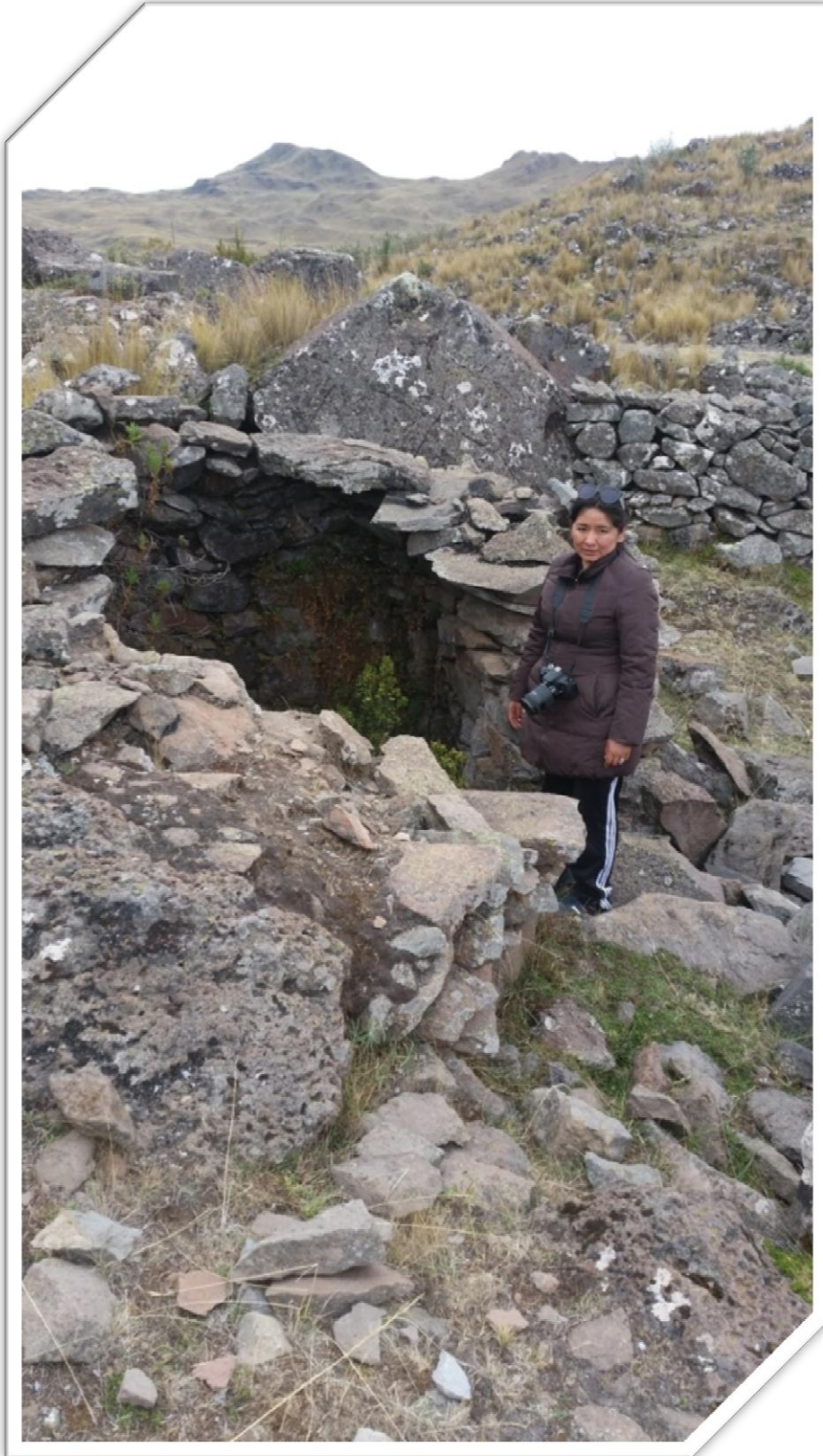
Imagen Nro. 7.11.: Vestigio de vivienda Inca