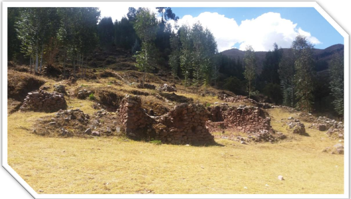
Imagen Nro. 7.3: Sitio Arqueológico de Raqaraqayniyoc.