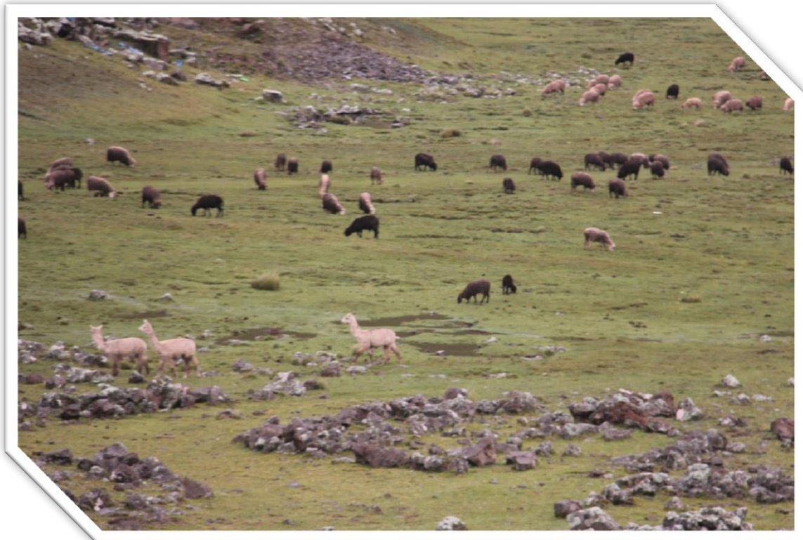
Imagen Nro. 7.8: Pastos naturales y ganado en el piso ecológico Puna