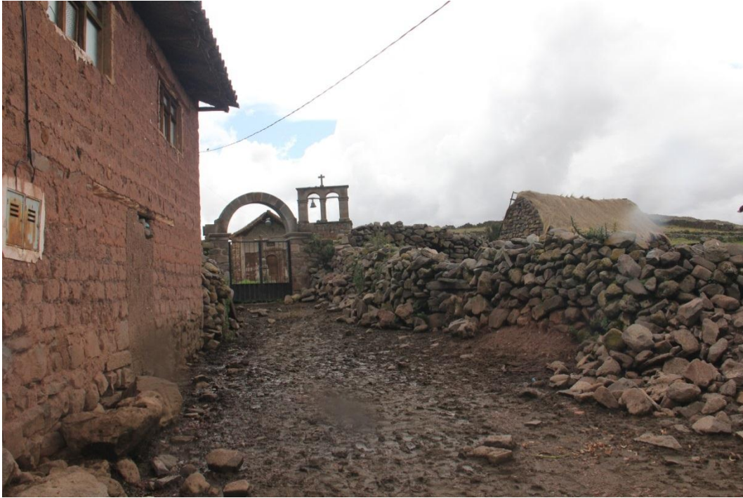
Imagen 03-Comunidad de Huaccoto.