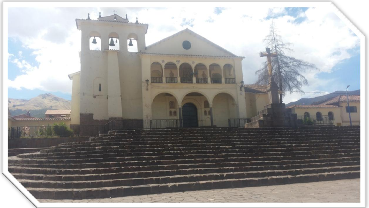
Imagen Nro. 7.1: Templo de San Jeronimo y cruz de piedra.