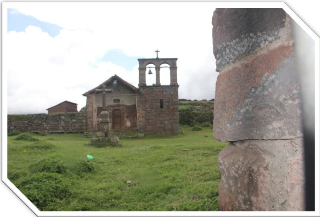
Imagen Nro. 7.6: Capilla de la Comunidad Campesina de Huaccoto.