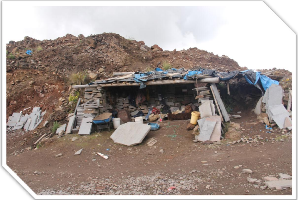
Imagen Nro. 7.12.: Campamento de un picapedrero.