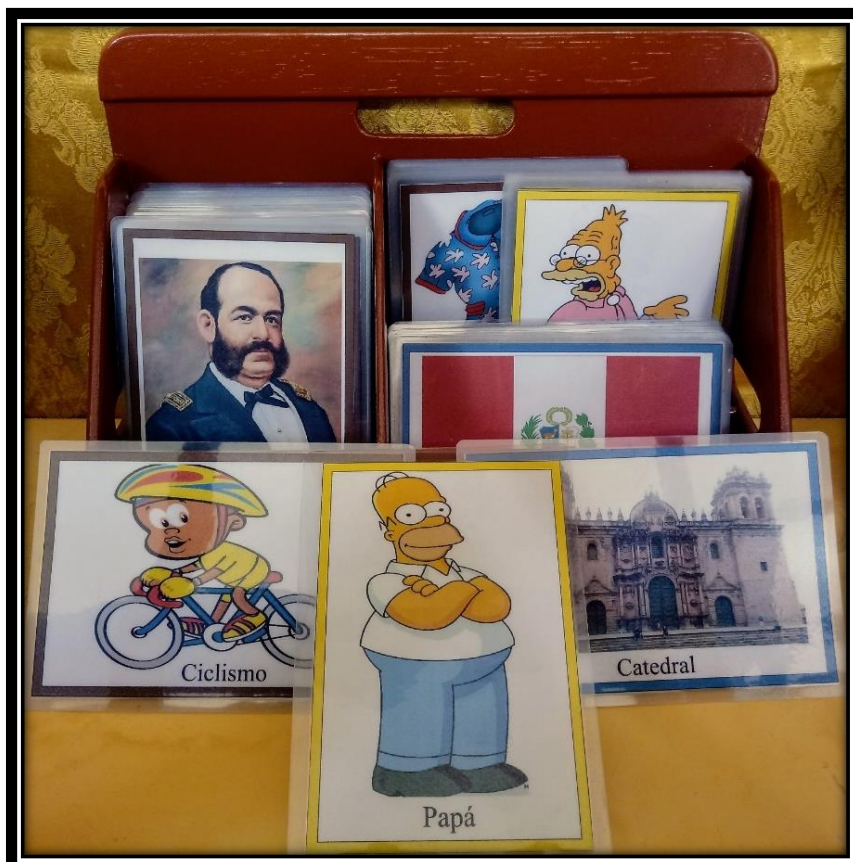
Figura 2: Tarjetas de la segunda categoría perteneciente al área de personal social