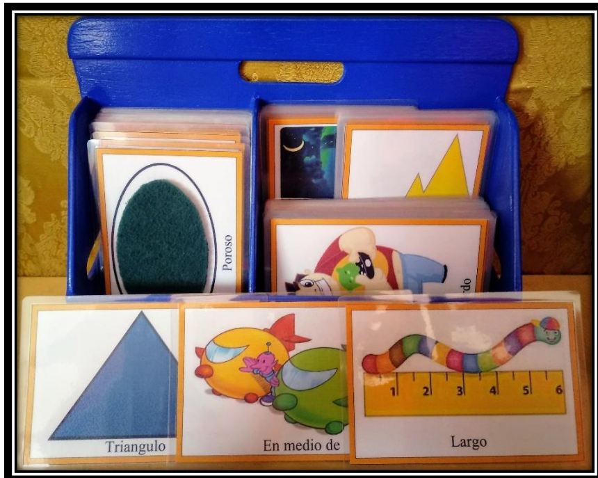
Figura 1: Tarjetas de la primera categoría perteneciente al área de matemática