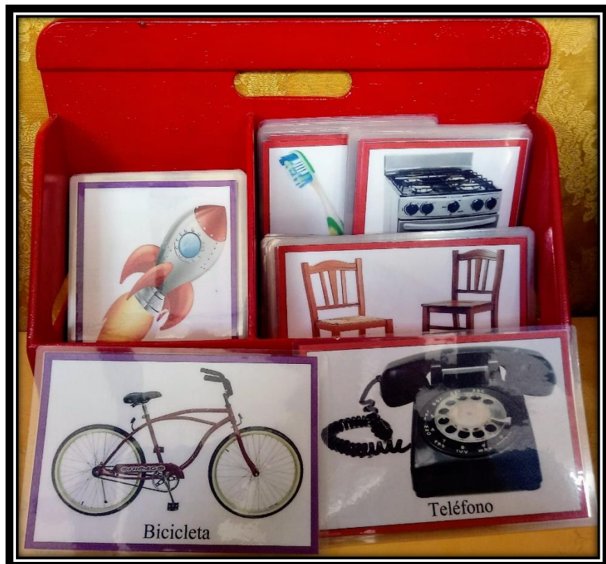
Figura 4: Tarjetas de la tercera categoría perteneciente al área de comunicación