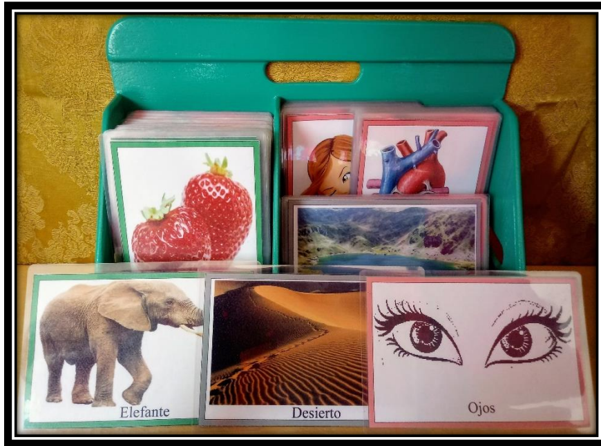
Figura 3: Tarjetas de la tercera categoría perteneciente al área de ciencia y ambiente